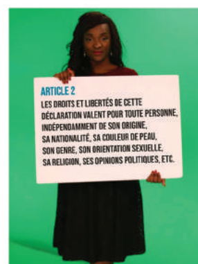
Campagne pour les 70 ans de la Déclaration Universelle des Droits Humains (2018)