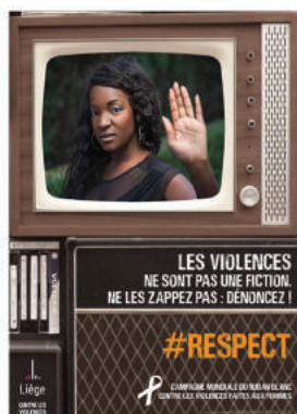
Campagne mondiale du Ruban Blanc contre les violences faites aux femmes (2018)