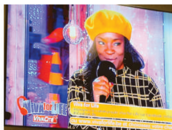
Invitée à VIVA FOR LIFE, l'opération solidaire de la RTBF luttant contre la pauvreté infantile (2017 et 2018)