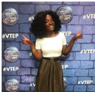
Vendredi Tout Est Permis - TF1

Cécile est devenue en quelques années une personnalité incontournable en Belgique. Fort de son succès, elle est depuis sollicitée par les médias de l'Hexagone.