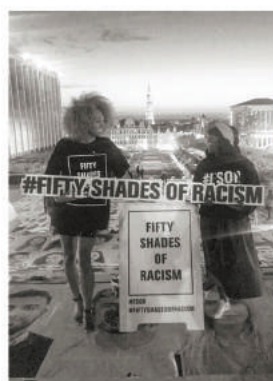
Exposition Choc contre le racisme Mont des Arts Bruxelles (2019)