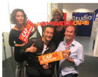
Bénévole chez CAP48, la récolte de fonds organisée en Belgique au profit des personnes handicapées (2017 et 2018)