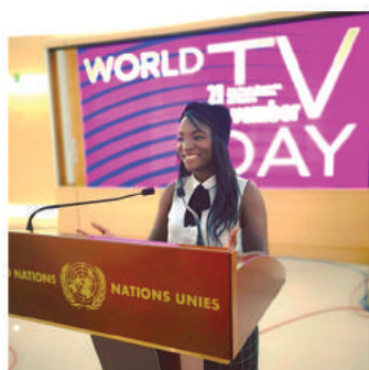
Invitée à l'ONU au siège de Genève, après sa vidéo buzz stop racisme, pour débattre de la diversité dans les médias (2018)