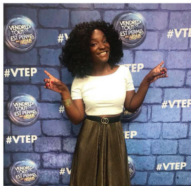
Vendredi Tout Est Permis - TF1

Cécile est devenue en quelques années une personnalité incontournable en Belgique. Fort de son succès, elle est depuis sollicitée par les médias de l'Hexagone.