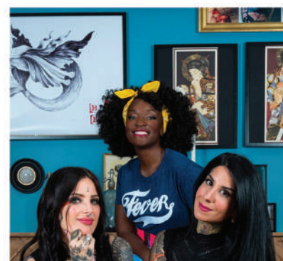
Animatrice Tattoo Cover TFX (Groupe TF1) et AB3 Belgique

Elle décroche dans la foulée son premier Prime en co-présentant The Voice Belgique . Son dynamisme et son capital sympathie lui offrent une aisance certaine lors des directs.