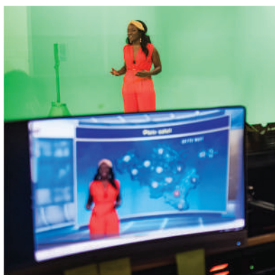
Miss météo RTBF et TV5 Monde

Depuis tout s'enchaîne et rien ne se ressemble!