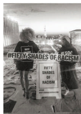
Exposition Choc contre le racisme Mont des Arts Bruxelles (2019)