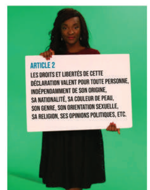
Campagne pour les 70 ans de la Déclaration Universelle des Droits Humains (2018)