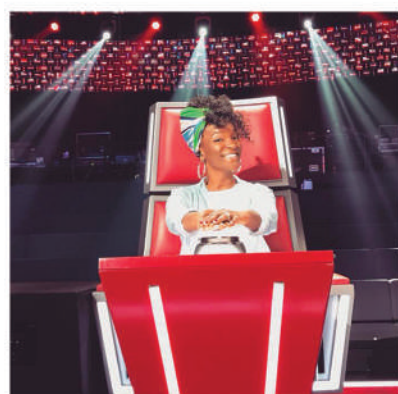
Co-animatrice The Voice Belgique

Elle décroche dans la foulée son premier Prime en co-présentant The Voice Belgique . Son dynamisme et son capital sympathie lui offrent une aisance certaine lors des directs.