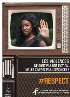
Campagne mondiale du Ruban Blanc contre les violences faites aux femmes (2018)