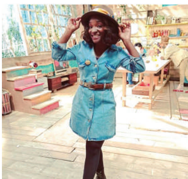
Animatrice - C'est Toujours Pas Sorcier - France 4

Actuellement, on peut la découvrir dans un nouveau rôle, celui d'exploratrice dans l'émission " C'est Toujours Pas Sorcier " sur France TV .