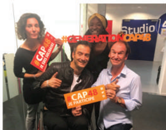
Bénévole chez CAP48, la récolte de fonds organisée en Belgique au profit des personnes handicapées (2017 et 2018)