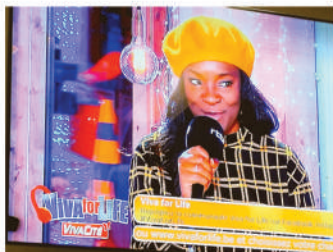
Invitée à VIVA FOR LIFE, l'opération solidaire de la RTBF luttant contre la pauvreté infantile (2017 et 2018)