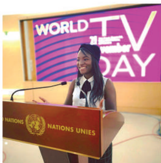
Invitée à l'ONU au siège de Genève, après sa vidéo buzz stop racisme, pour débattre de la diversité dans les médias (2018)